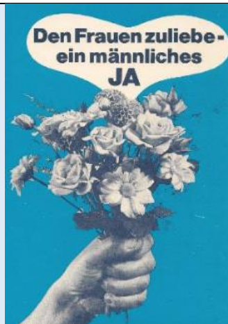
1971 wird das Wahl- und Stimmrecht der Frauen in der Schweiz nach einem runden Dutzend Vorstößen seit 1921 angenommen.